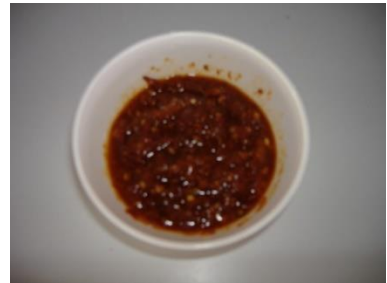
แจ่วเอือดดำ