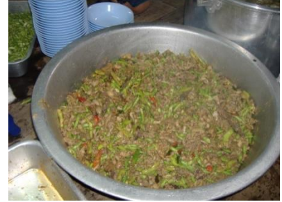
ผัดเผ็ดไส้หมู